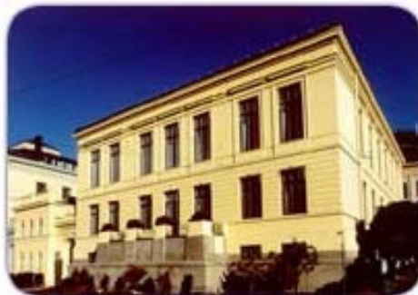
Das norwegische Nobel-Institut, Oslo