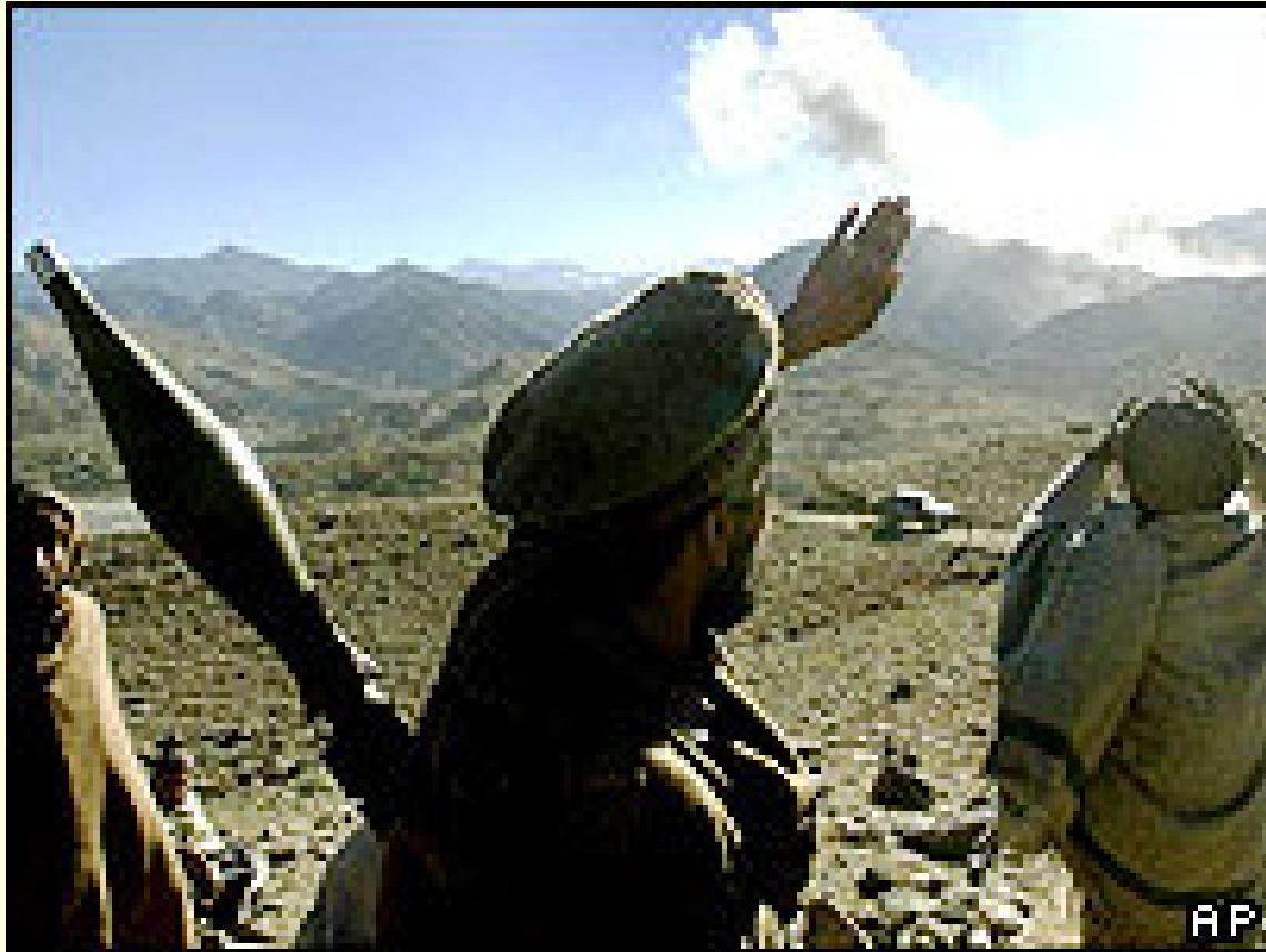
Tora Bora, Afghanistan