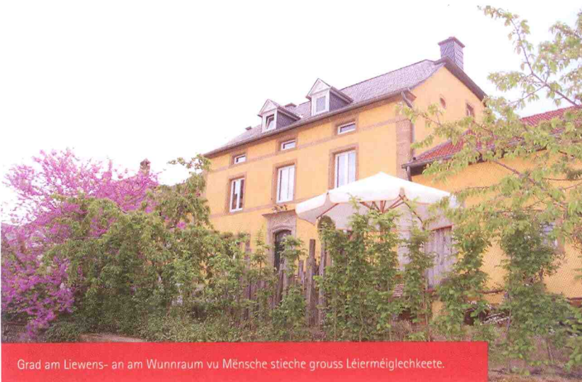
Grad am Liewens- an am Wunnraum vu Mënsche stieche grouss Léierméiglechkeete.